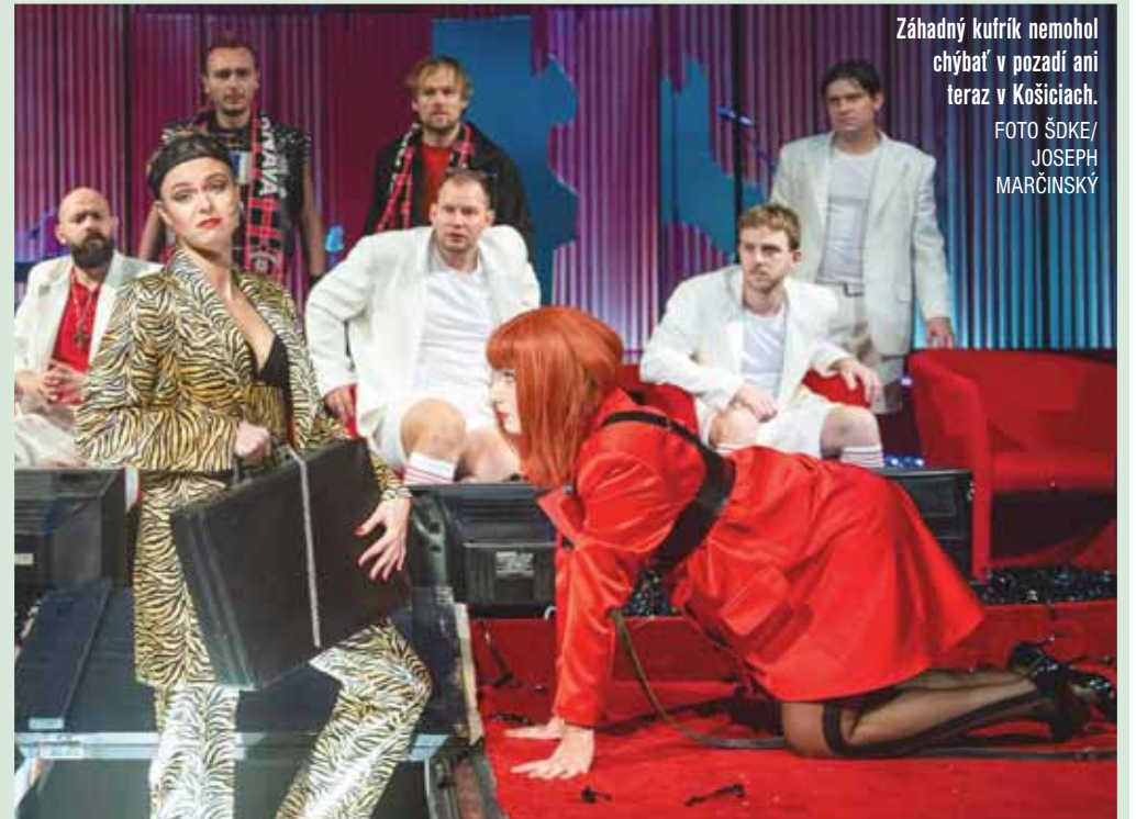
Záhľadný kufřík nemohol chýbať v pozadí ani teraz v Košiciach.