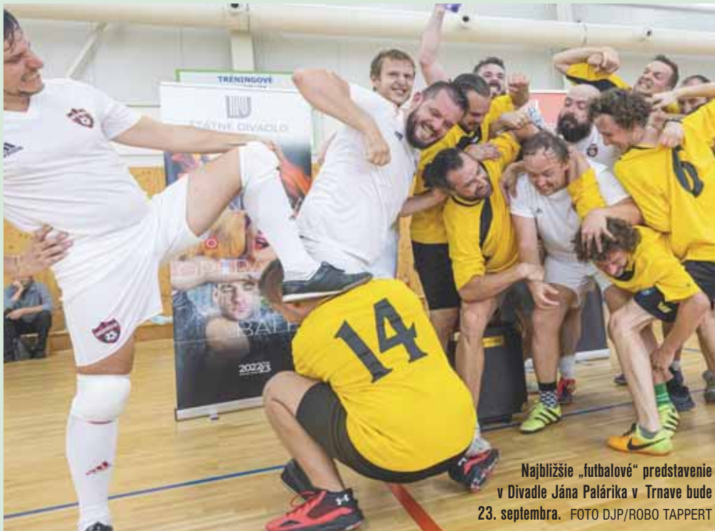
Najbližšie „futbalové“ predstavenie v Divadle Jána Palárika v Trnave bude 23. septembra.