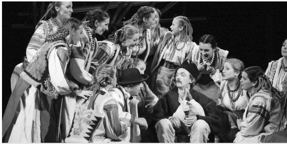
Národné akademické ukrajinské činoherné divadlo Márie Zaňkoveckej z Lvova, ponúkne aj komediálnu hru s prvkami folklóru Historky o Ivanovi nájdené v maľovanej truhlici s nápismi.