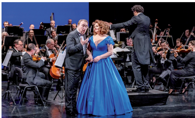
Košické operné stálice oslávili svoje jubileá vydatým galakonzertom.