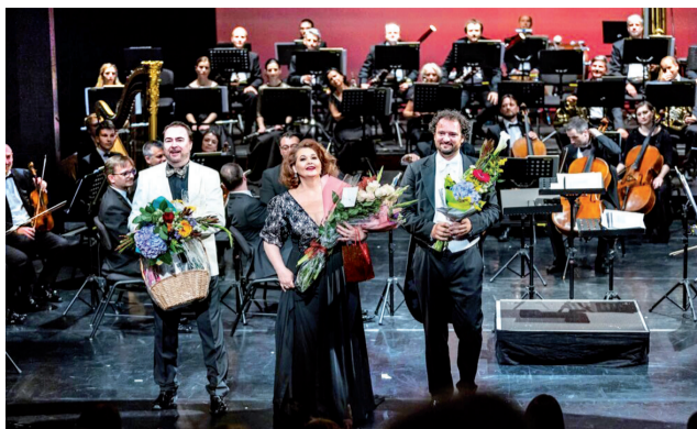
Radosť z toho, že konečne stáli na javisku, bola neľahostojná.