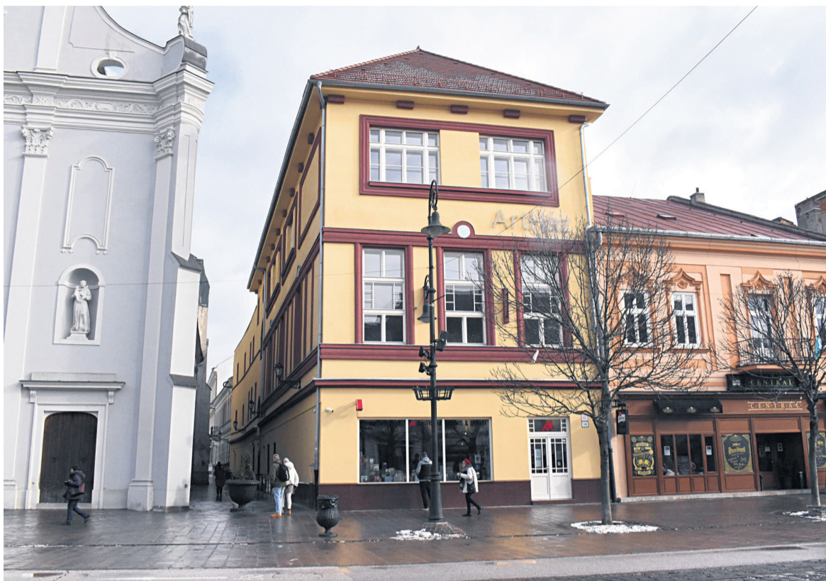
Skladové priestory má divadlo v centre Košíc.

Štátne divadlo čakalo na verdikt súdu takmer 30 rokov